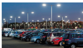
СТОЯНКИ И ПАРКОВКИ